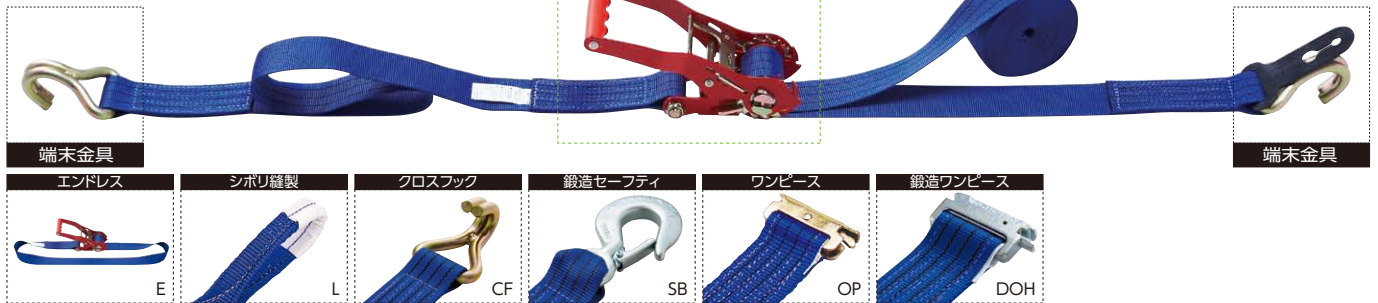
写真: 品番 LBR 804M CF10-50CF